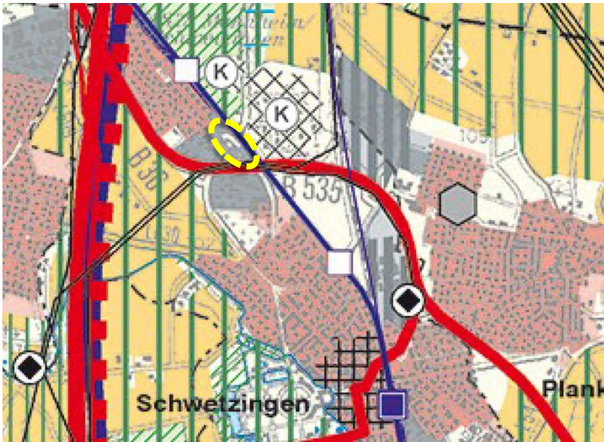
Abb. 2: Ausschnitt aus der Raumnutzungskarte des Einheitlichen Regionalplans Verband Region Rhein-Neckar, Stand 15.12.2014